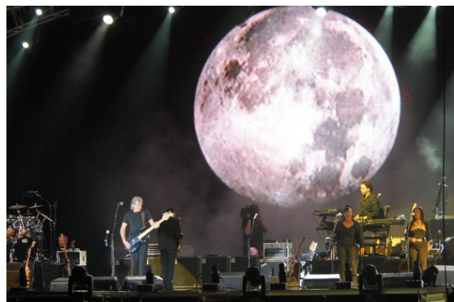
Roger Waters playing with Turbosound at Copenhagen Roskilde Festival